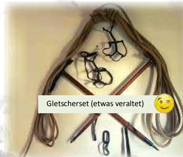
Gletscherset (etwas veraltet) 😊